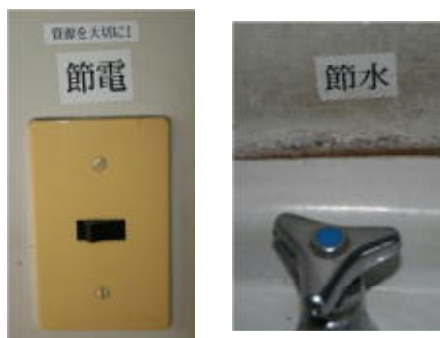
各所の電気水道の注意喚起