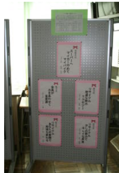
エコ標語部門の優秀作品