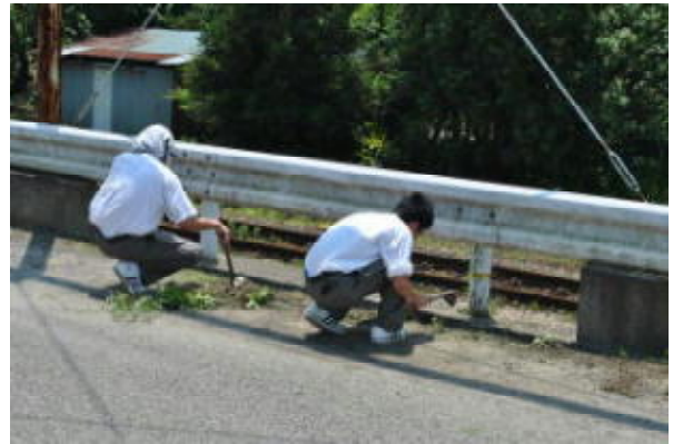
周辺の道路も除草等美化活動実践中