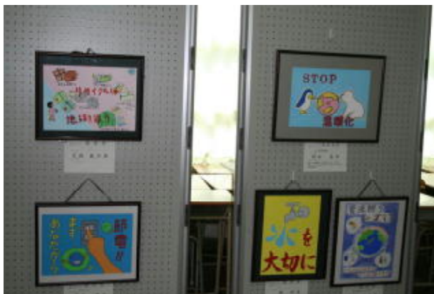
エコポスターの優秀作品