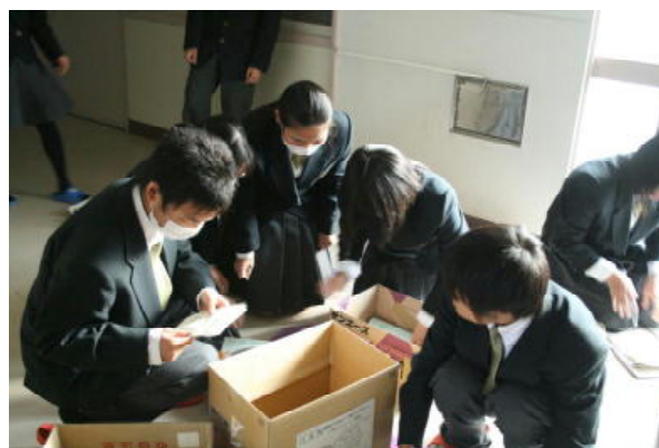
各クラスで集めた雑紙はまとめて業者へ