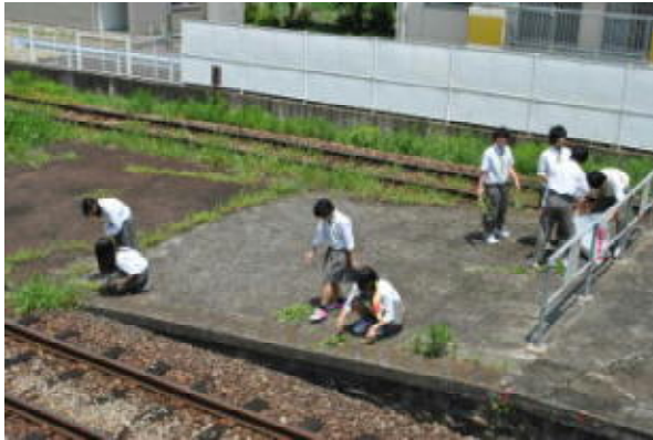
毎学期期末考査最終日に実施