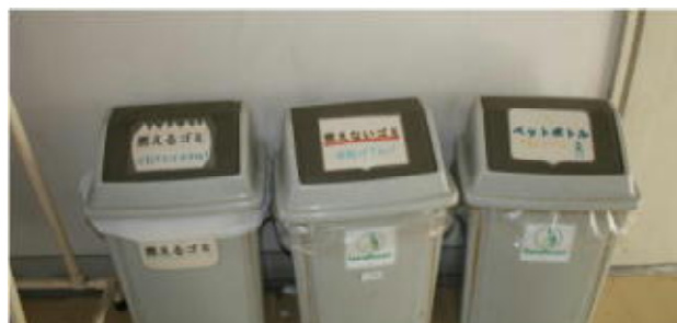
校内各所にゴミ箱を設置